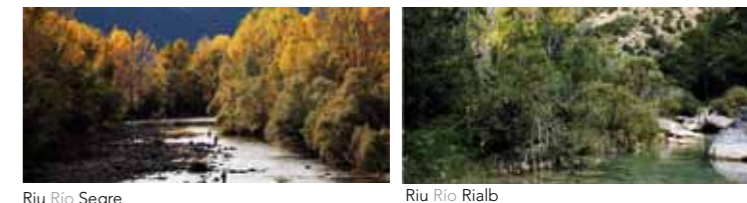
Riu Rio Segre Riu Rio Rialb